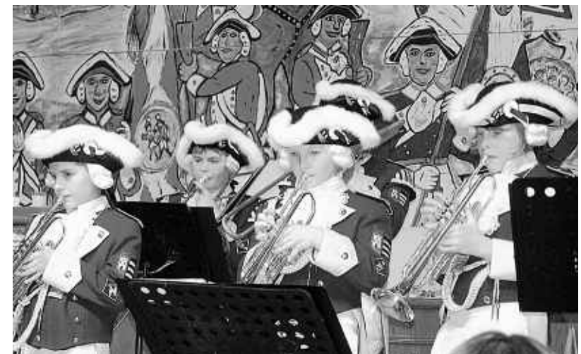
Um den musikalischen Nachwuchs muss man sich bei der KG Lätitia Blaue Funken Weisweiler keine Sorgen machen.