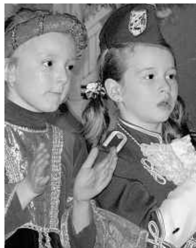
Kamen aus dem Staunen nicht heraus: die kleinen Reservisten.

Besonders freuten sich kleinen Hehlrath über die Besuche zahlreicher befreundeter Vereine: So stattete der Nachwuchs der KG Nothberger Burgwache, der Löstigen Wollklös Mausebach, der KG Kirchspiel Lohn, der Löwengarde und der KG Prinzenhilfe dem Ulk einen Besuch ab. Besonderer Höhepunkt an diesem Nachmittag war ein Zauberer, der den Kindern Tricks beibrachte. (bine)