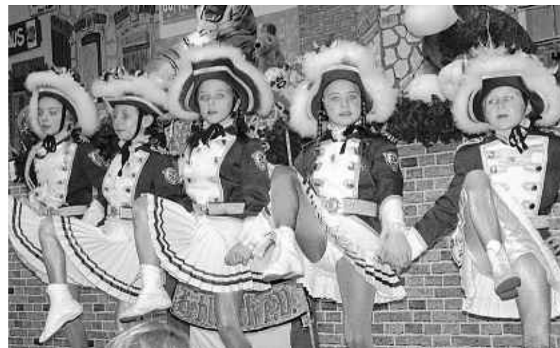
Sie sind der Stolz des Vereins: Die Jugendgarde der KG Ulk Hehlrath präsentierte sich vor heimischem Publikum in bester Form.